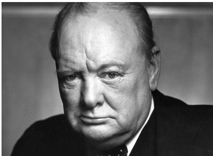
Sir Winston Churchill, forsætisráðherra Bretlands