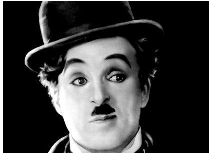
Charlie Chaplin, leikari og leikstjóri