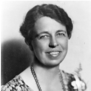
Eleanor Roosevelt, forsetafrú og stjórnmálaleiðtogi

Innan Oddfellowreglunnar er breiður og fjölbreyttur hópur fólks úr öllum stéttum samfélagsins. Til gamans má nefna hér nokkra þekhta Oddfellowa.