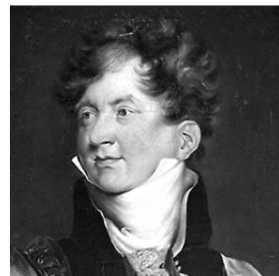
Georg IV, Englandskonungur 1820-1830