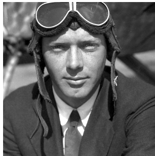
Charles A. Lindbergh, flugmaður og rithöfundur