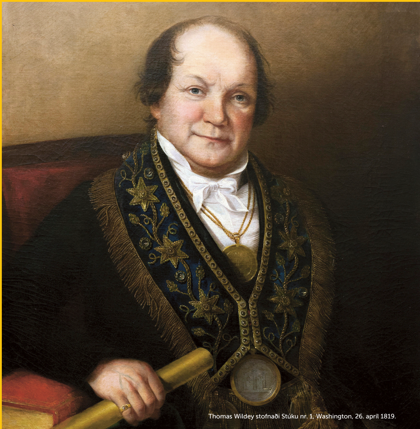
Thomas Wildey stofnaði Stúku nr. 1; Washington, 26. apríl 1819.